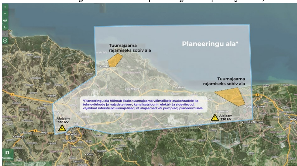
Joonis 1. Planeeringuala ettepanek koos võimalike tuumajaama asukohtadega

Lisaks on Fermi Energia analüüsinud neid potentsiaalseid piirkondi projekti elluviidavuse ja tasuvuse vaatest 22 . Loksa piirkond välistati, kuna see asub keset Lahemaa rahvusparki, mis muudab väga keeruliseks vajalike ühenduste loomise (elektriliinid, liinikoridorid, teed, torustikud jne). Varbla piirkond välistati keskkonnakaitseliste piirangute (ümbristatud ühelt poolt olemasoleva Varbla looduskaitseala ja teiselt poolt loodava looduskaitsealaga) ja vähese sotsiaalmajandusliku sobivuse tõttu. Selles piirkonnas on elektrivõrk nõrgem võrreldes Ida-Eestiga, kus tänane elektritootmine peamiselt asub. Ka uute ühenduste rajamise puhul konkureeriks tuumaelektrijaam sellesse piirkonda planeeritavate meretuuleparkidega ühendusvõimsustele. Samuti on meri suhteliselt madal, mis ei ole optimaalne jahutusvee kasutamise vaates ning kätkeb teatavat ülejutusrisiki. Projekti elluviidavuse ja tasuvuse analüüsi tulemustele tuginedes on tehtud ka planeeringuala ettepanek (joonis 1).